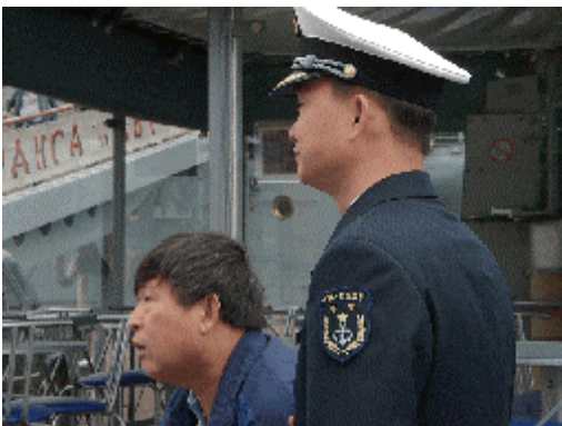
中国海軍部隊隊員

町の中心のネフスキー大通りをはじめ、観光客の多さには正直驚いた。5年前はそうでもなかったように思うが、京都で言えば「桜の季節の哲学の道」か東山五条の「清水道」のようだった。車の渋滞も相当なひどさで目的地を目の前にして時間がかかる。通りは左折禁止（ロシアは右側通行）だから狭い通りを（しかも駐車がいっぱい）右折・右折・右折で左折することになりこれも時間がかかる原因。巡洋艦オーロラ号の時、たくさんの軍人が集合写真などを撮っているのでよく見ると「中華人民解放軍海軍」の襟章をつけている。どうやら中国海軍部隊が民間人としてでは