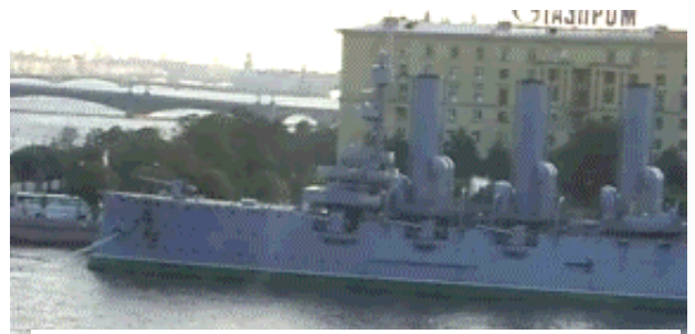
ホテルの窓から巡洋艦オーロラ号が目の前に

レニングラード攻防戦では市街地の1/6が破壊された。イサーク寺院は守り抜かれたが、柱には爆弾や砲弾のあとが残っている。金箔のドームは黒く塗られ、周りには気球がいくつも上げられて戦闘機が近づけないようにして爆撃を避けた。エルミタージュは屋上に緑の網を敷