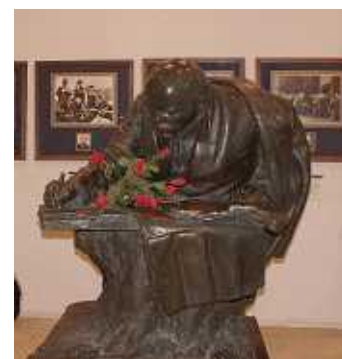
執筆中のレーニン

次はアレクサンドルネフスキー寺院の芸術家の墓地へ、6年前にもきたので省略。午後は、レーニンが革命の構想を練ったといわれる、ペトログラード郊外のラズリフ湖を訪ねる。記念館とはいえ今はほとんど訪れる人もなく、駐車場には私たちのバスだけ。しまっているのかと思ったがドアをたたくと開けてくれた。中は天井からつるされた大型の透かしの写真とわずかな展示。(右上のレーニンの写真) レーニンとクルプスカヤ、スベルドロフ、コロantai、イネッサアルマンドなど。