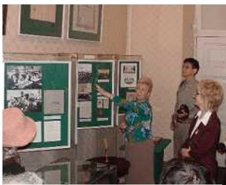
スモーリヌイのレーニンの居室