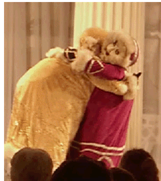
これは一人が二役を！