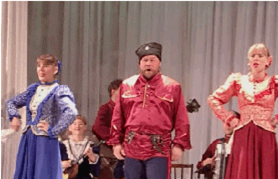
陽気なコサックダンス

『ニコライ宮殿』にて、サヨナラ夕食パーティ。ここで一同そろっての自己紹介。次々この旅行への期待や感想が語られる。会場をホールに移してフォークロアショーを鑑賞。出演はコサックダンスの一団。これが陽気で楽しい。