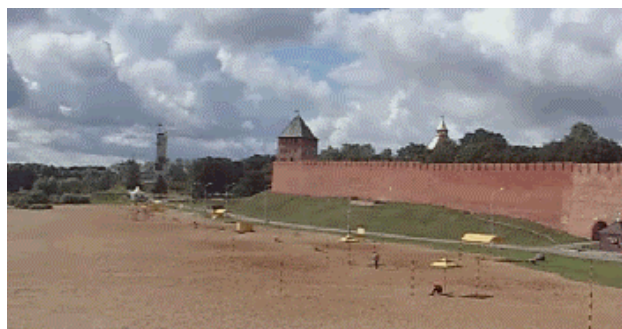
ノボゴロドの城壁