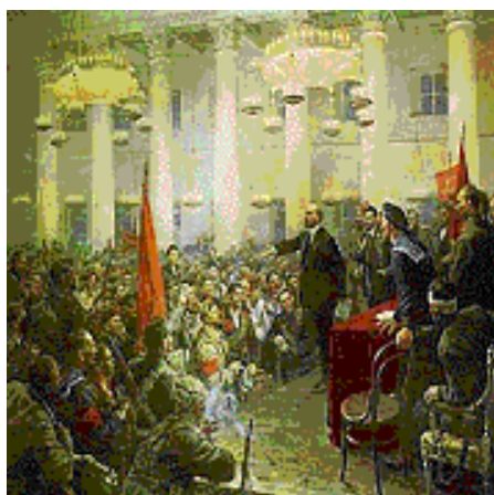
スモーリヌイで演説するレーニン

ここはレーニンを中心とするボリシェビキが革命の指導にあたった革命本部となった建物で、レーニングラード・ソヴィエト中央委員会、中央執行委員会が置かれた。モスクワに首都が移るまでレーニンは革命前後をスモーリヌイの一室に住み執務していた。寄宿学校は現在はサンクト・ペテルブルグ市役所として使用されている。今回は特別許可を得て内部の見学が許された。2階のレーニンの執務した部屋の前の廊下の壁には大理石に掘り込んだ革命憲法が掲げられている。