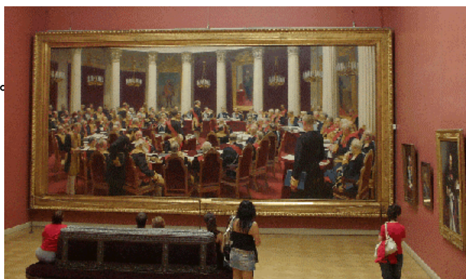
イリヤ・レービンの「1901年5月7日国家評議会会議」

もとはミハイロフ大公の宮殿として1825年に建てられたが、その後の改築工事が施され、1898年に国立民族造形美術館としてオープンした。ロシア美術館のパンフレットを読むと「所蔵40万点」とあるが「エルミタージュからロシア絵画のすべてと彫刻などがロシア美術館に移された」とある。革命後も国立美術文化大学のコレクションも移管され一層の充実を見ている。やはり見る価値があったといえる美術館だ。