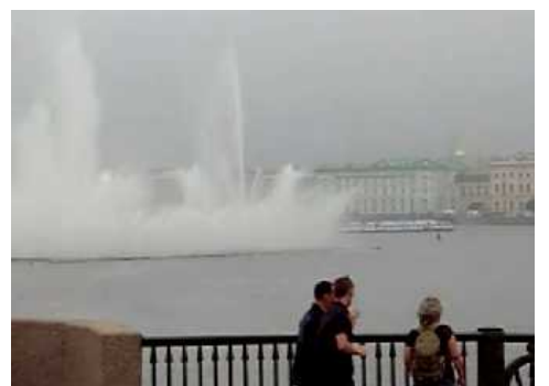
5年前にはなかった巨大な噴水