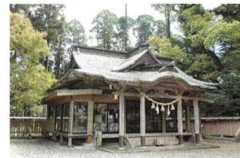
神楽殿・御輿庫(旧拝殿)

旧記によれば、日向国の第一の大社であったが、天正年間の大友・島津の争乱の際、御神体は避難されたものの、社殿・宝物・古文書などすべて焼失し、小さな祠があるのみ状態となった。 その後秋月種政が元禄五年に復興し、安政六年に再建され、明治四年五月に県内最初の国幣社に列せられた。現在の御社殿は、旧社殿「末社」熊野神社(旧本殿)神楽殿・御輿庫(旧拝殿)の老朽化に伴い、平成十四年より「平成の大造営」と銘打って氏子崇敬者のご協力により、平成十九年七月に竣工した。