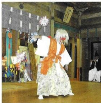
都農神楽 六番 鬼神舞