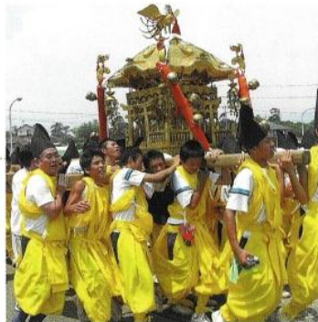
御神輿は国幣社列格50周年を記念し、大正11年に新調された。

現在でも県内外において勇壮で盛大なお祭りであり、その中でも2日のお宮入りは特に圧巻である。